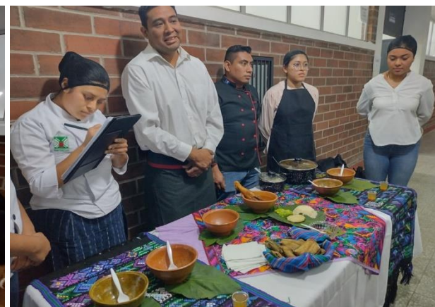
Presentación de platillo Subanik, en el curso de Cocina Típica Guatemalteca