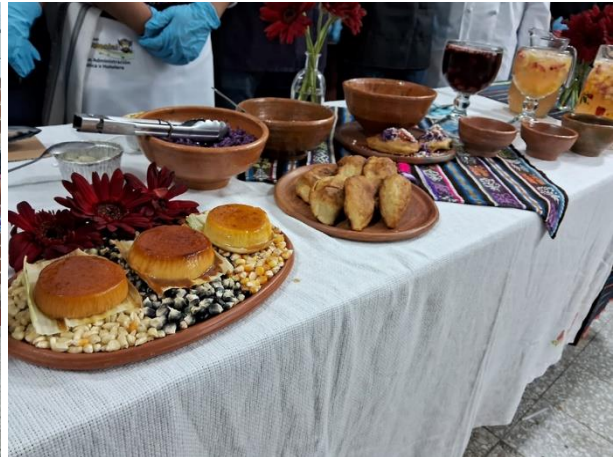
Presentación Final de Platos en base al Maíz, curso de Cocina Típica Guatemalteca