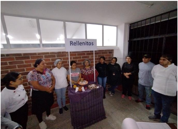
Presentación de platillo Rellenitos, en el curso de Cocina Típica Guatemalteca