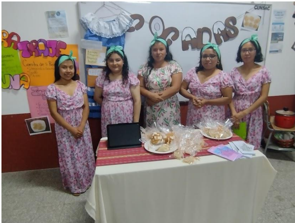
Presentación de Platos Regionales en el curso Geografía General e Historia Turística de Guatemala