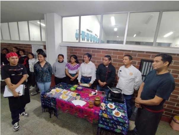
Presentación de platillo Arroz en Leche, en el curso de Cocina Típica Guatemalteca