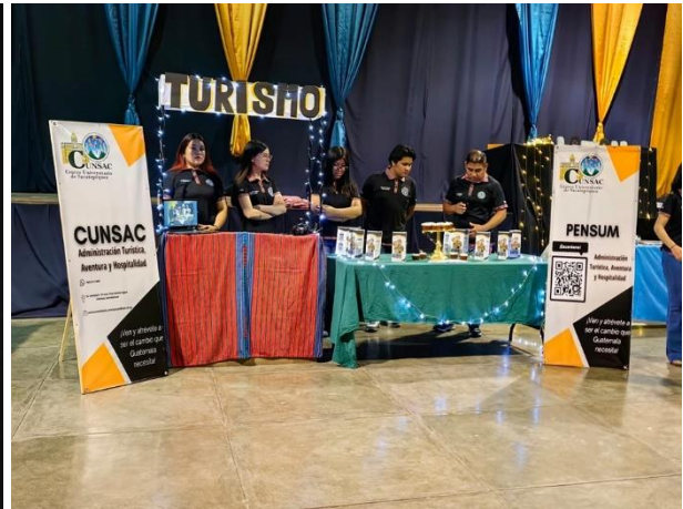
Presentación Final de curso de Promoción y Publicidad Turística