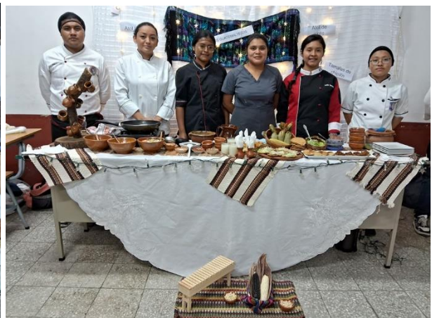
Presentación Final de Platos en base al Maíz, curso de Cocina Típica Guatemalteca