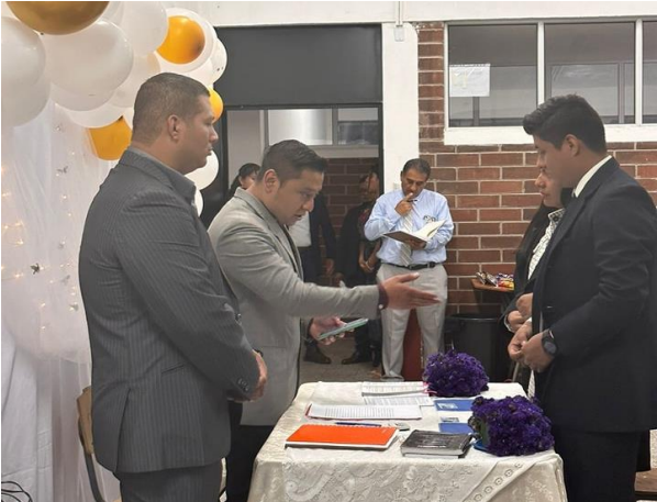
Ejercicio práctico de Boda en el curso Derecho Civil