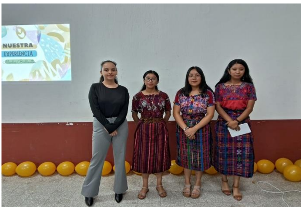
Presentación Final de curso de Administración I