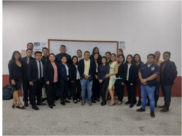
Presentación informe del curso Gestión de Patrimonio Cultural