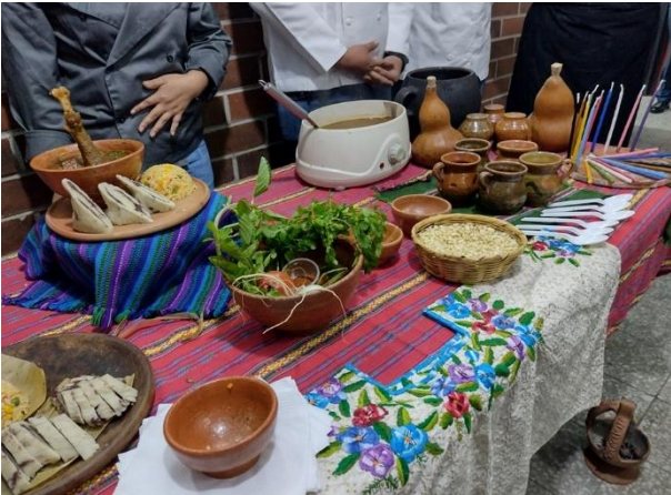
Presentación de platillo Jocón, en el curso de Cocina Típica Guatemalteca