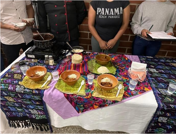
Presentación de Estofado, en el curso de Cocina Típica Guatemalteca