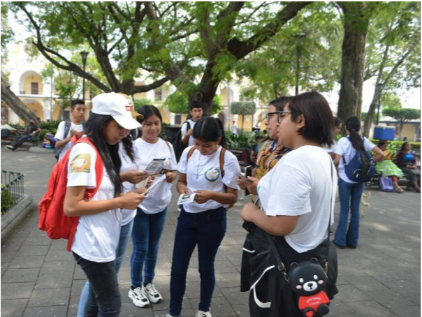
Apoyo en las actividades de INFOCUNSAC